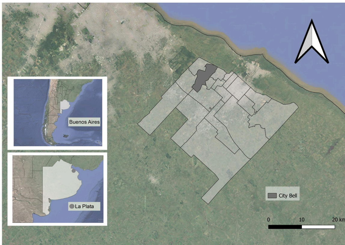
Figura 1. Localidad de City Bell.