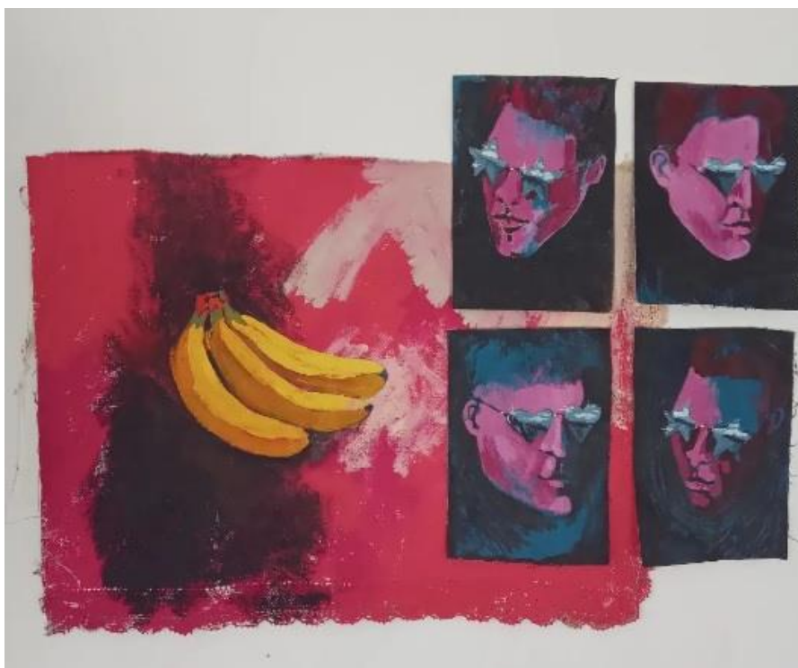
Imagen 4. Una de las más recientes obras de Agustín, Corazones, estrellas y bananas. Acrílico sobre lienzo.