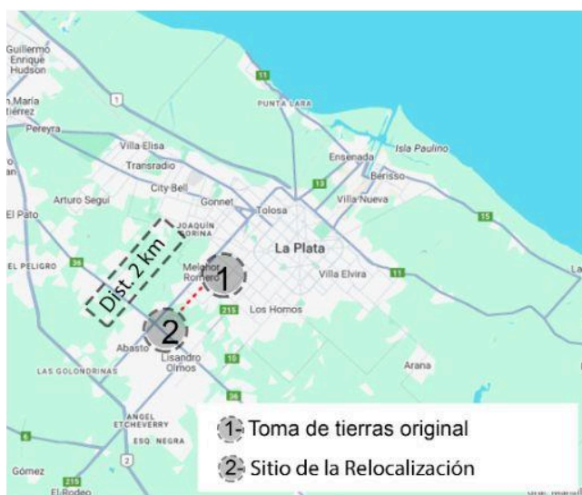
Figura 6: Caso 5

La relocalización no estuvo exenta de conflictos, los residentes más antiguos desconfiaban de la capacidad de la zona para albergar una nueva población tan numerosa. Con el tiempo, el barrio comenzó a expandirse de manera informal, ocupando terrenos cercanos, incluidos aquellos adyacentes a una cantera abandonada. En la actualidad, Terra Mía II es considerado un barrio popular registrado en el RENABAP, con 165 familias según registros oficiales. No obstante, los relatos de los vecinos indican que el barrio se extiende más allá de los límites establecidos en el registro.