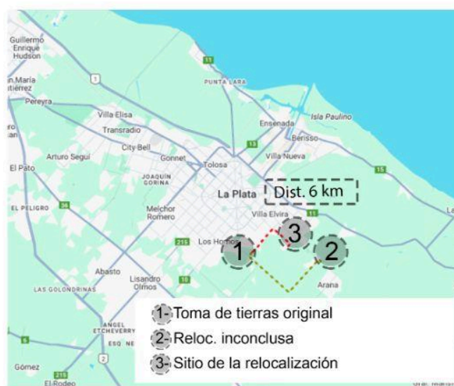
Figura 4: Caso 3

Debido a lo anterior se llegó a un acuerdo para constituir el nuevo asentamiento en otro predio ubicado en Barrio Aeropuerto. Así nació el barrio "La Falcone" 3 , nombrado así en honor a la organización que lideró el proceso. Actualmente, unas 77 familias habitan en este sitio, que pese a haber conseguido ciertos avances en su urbanización, sigue siendo considerado una barriada popular por el RENABAP.