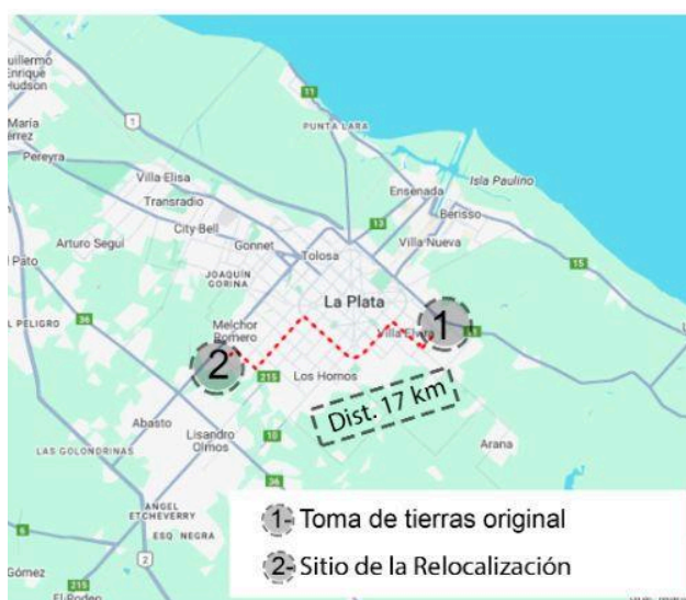
Figura 7: Caso 6

En la actualidad, los vecinos del nuevo asentamiento lograron diferentes niveles de avances en la construcción de sus viviendas. Según el RENABAP este barrio se unificó con un aledaño formando un único polígono llamado San Cayetano donde habitan unas 242 familias.