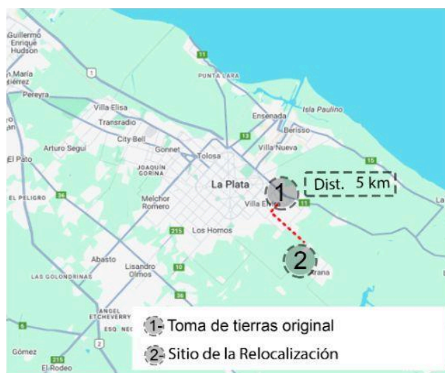
Figura 2: Caso 1

Actualmente, el barrio es hogar de unas 175 familias y, aunque ha mostrado signos de consolidación, sigue siendo considerado un barrio popular por el RENABAP. A pesar de los avances comentados, después de casi treinta años, las familias no han logrado obtener ciertos derechos fundamentales, tales como la regularización de su situación dominial.