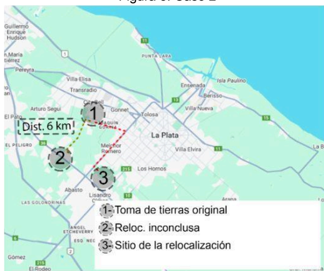
Figura 3: Caso 2

Inicialmente, se acordó trasladar a las familias a Colonia Urquiza, pero la oposición de los residentes locales impidió el traslado, lo que forzó a las familias a alojarse en hoteles temporalmente. Finalmente, el Ministerio de Salud de la Provincia de Buenos Aires donó 1,4 hectáreas en la localidad de Romero para la relocalización definitiva. Tras diversas negociaciones se logró un plan de construcción de viviendas y provisión de servicios básicos en el nuevo barrio, que fue nombrado “La Emilia” en honor a una referente de la CTA que acompañó todo el proceso.