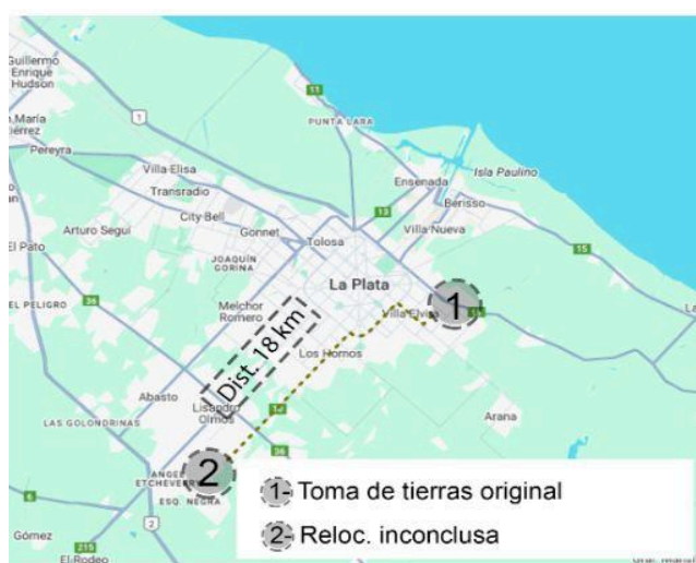
Figura 5: Caso 4

Un mes después, el 24 de noviembre, el Concejo Deliberante de La Plata decidió ceder un terreno de cuatro hectáreas en Olmos, a unos 18 kilómetros del lugar original de la toma. Sin embargo, la falta de un plan de viviendas, la lejanía de servicios, y la falta de infraestructura, sumadas al abandono del proceso por parte del municipio, impidieron que las familias pudieran concretar su mudanza.